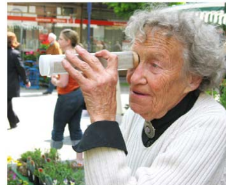
„Binde Deinen Karren an einen Stern“ Ihr Leitmotiv: